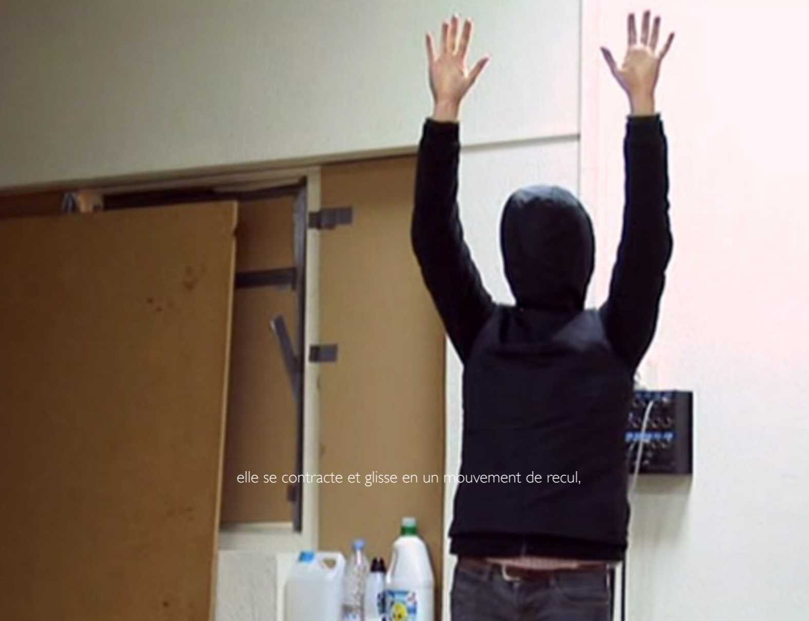
elle se contracte et glisse en un mouvement de recul,