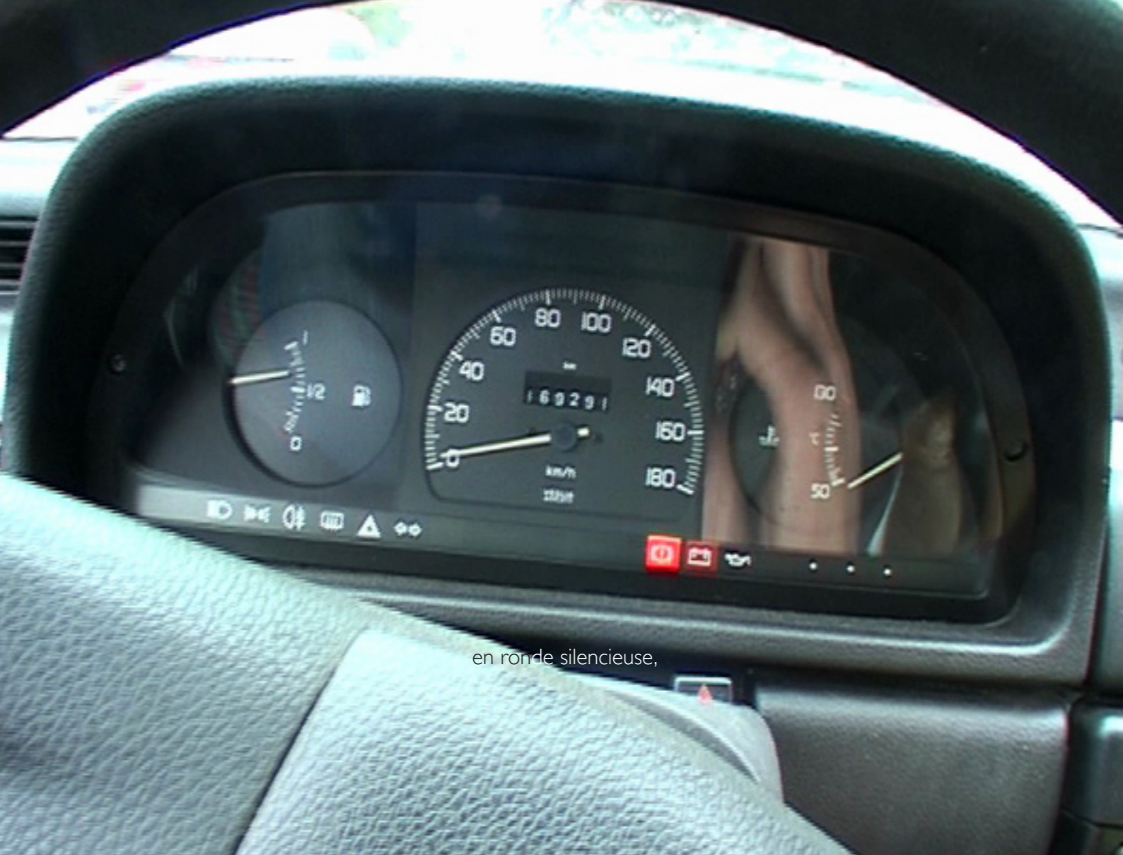
en ronde silencieuse,