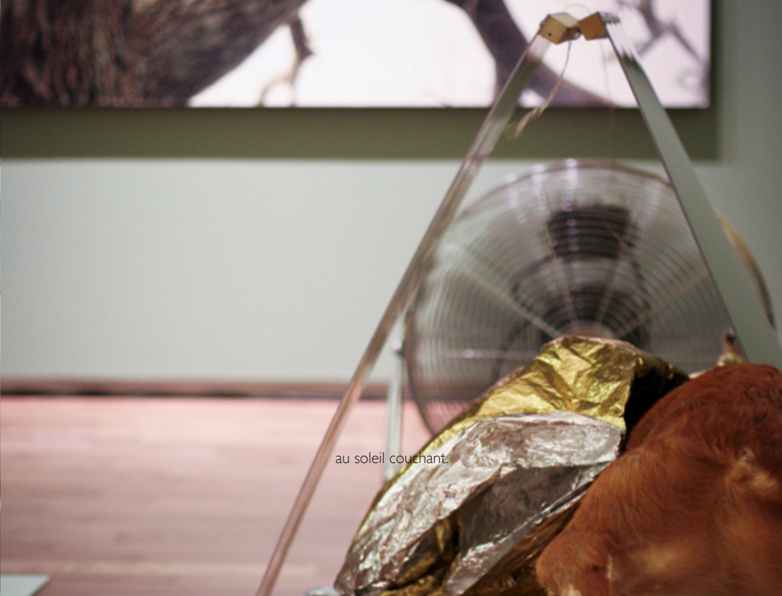
au soleil couchant.